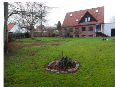
Banevænget 16 og lille udpluk af Østhaven

Banevænget 24: (nr. 6 på teningen) Villa med kælder og isoleret anex i haven