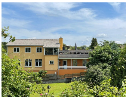
Rønnevej 19 B