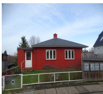
Rønnevej 19 A